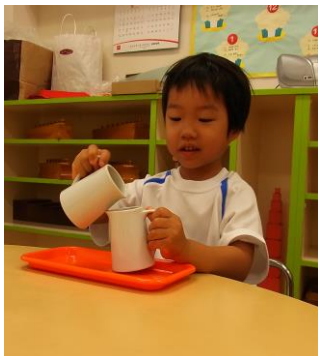
お仕事しています・・・