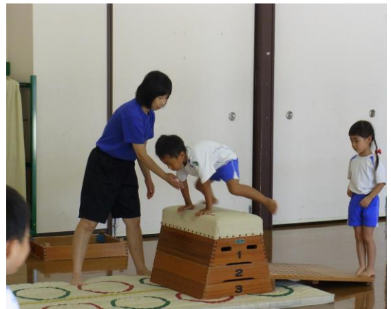
体操教室の先生の指導